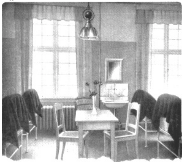
4 sengs stue