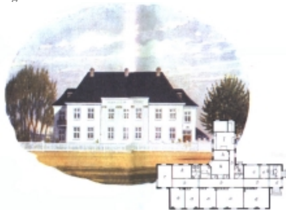
Klinik for øjensygdomme Marselis Tværvej 4, Århus C. Opført 1914